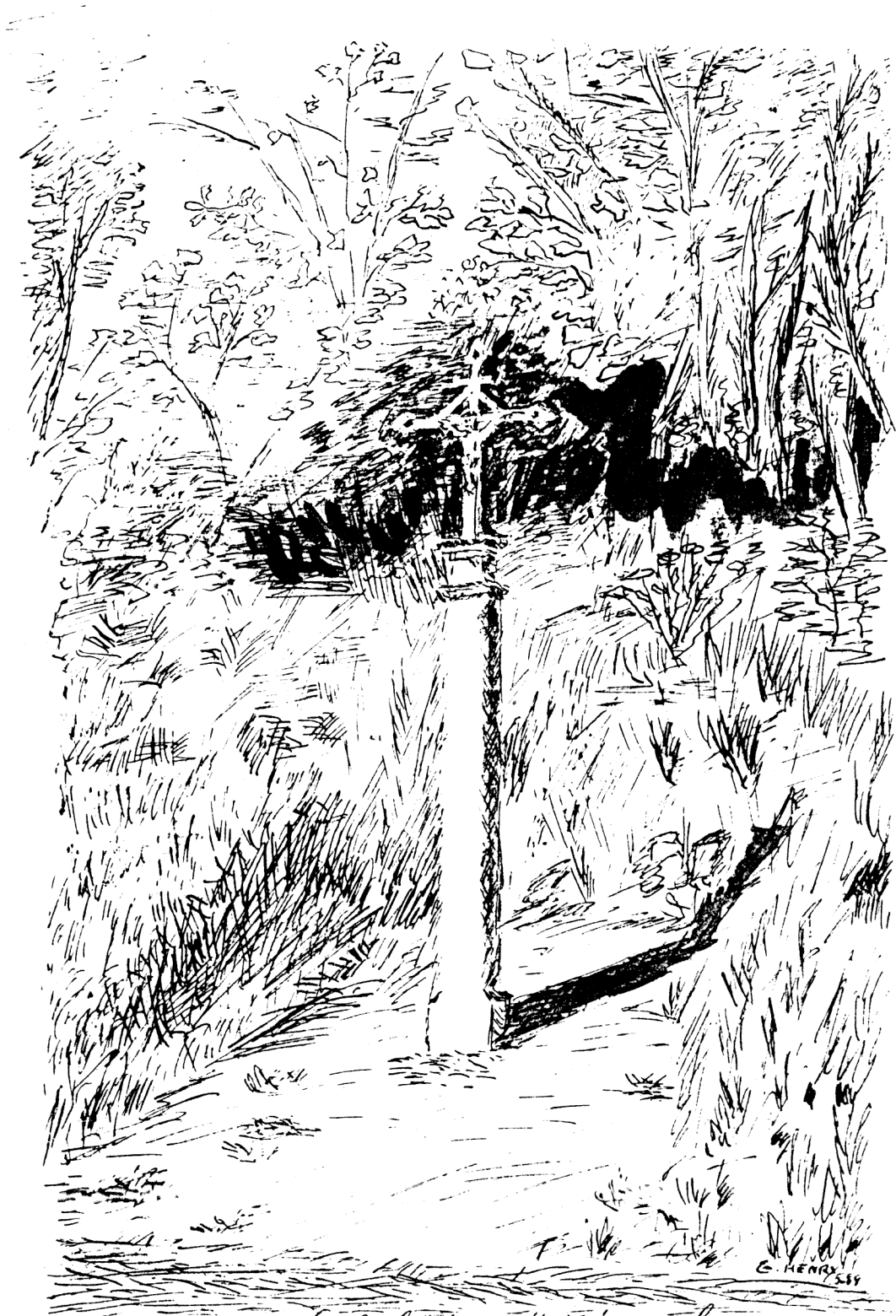
Le Calvaire d'Herouval.