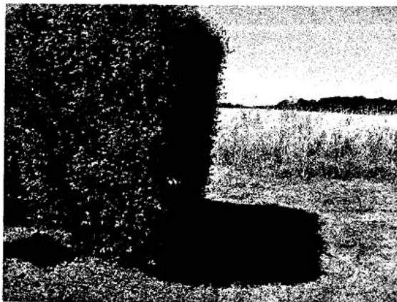
Haut du Chemin aux Ânes

La commune émet une réserve quand à la visibilité du poteau incendie du chemin aux Ânes, qui sera située au niveau du calvaire, les élus souhaitent dans la mesure du possible que le poteau se voit le moins possible.